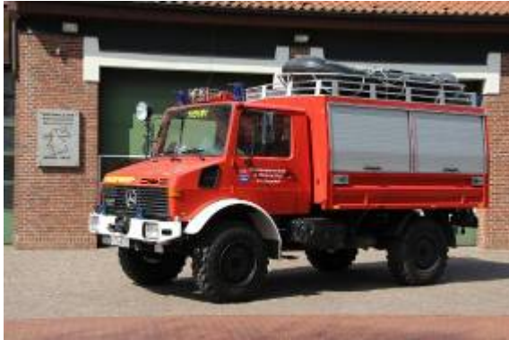
Rüstwagen Rw1 Florian Plön 11/51/01 Baujahr: 1990 Fahrgestell: Daimler Benz U1300L Aufbau: Wackenhut