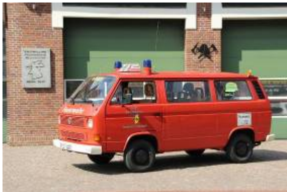
Mannschaftstransportwagen MTW Florian Plön 11/19/01 Baujahr: 1990 Fahrgestell: VW – T3 Aufbau: eigen